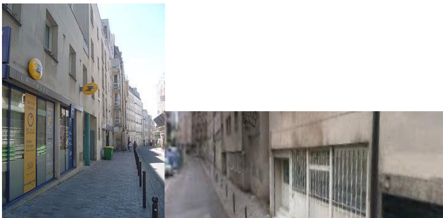
Entrée de PREAUT = Porte Grille Blanche 13 rue du Docteur Laurent Paris 13